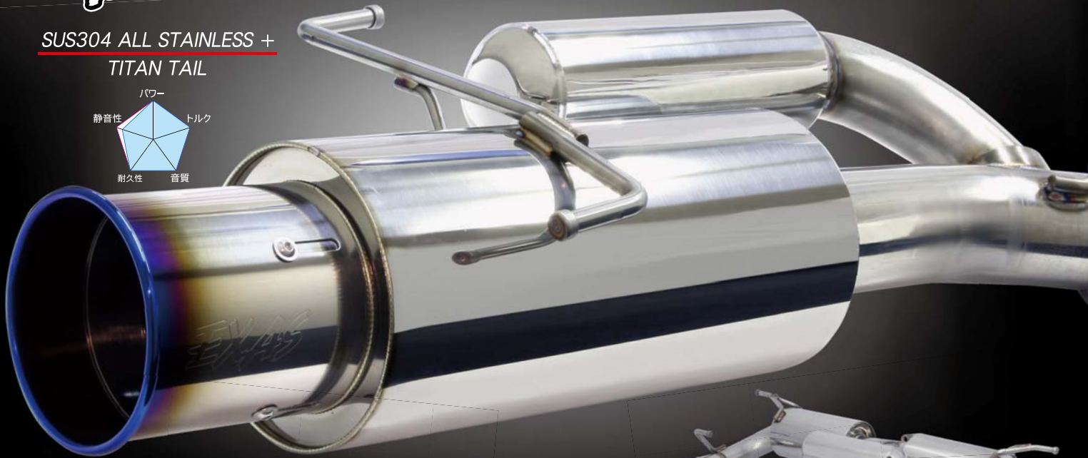
■スワフトスポーツ ZC31S