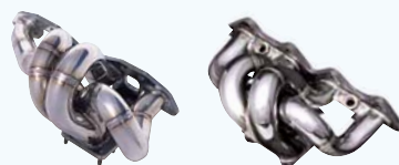
S14/S15用 EXマニホールド CN9A/CP9A用 EXマニホールド

純正タービンから、純正置き換えタイプタービンまで幅広く対応するエキゾーストマニホールド。パイプを等長化する事でハイスボンズ・ハイブーストを可能とし、パイプ集合各部に補強を施す事で耐久性も確保している。