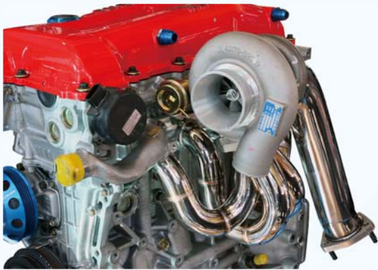
注:画像のエンジン及びタービン本体は製品には含まれません。

T5 18ZやGT-RSなど純正置き換えタイプのタービン及び純正タービンを、ビッグタービンキットの様にEXマニの上側にセットするEXマニとアウトレットパイプのセット。等長タイプのEXマニなので、高回転域での伸びとレスポンスの良さに加えて、通常の下向きにセットするEXマニとは違った排気音も魅力。タービンのメンテナンス性も向上するので、タービントラブル等を未然に防ぐ事も出来、エンジンルームのドレスアップにも効果抜群です。