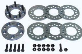
マルチトレッドスペーサー 適合表