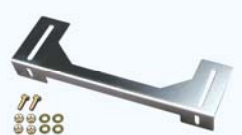
SLIDE NUMBER STAY