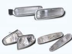
CRYSTAL WINKER SILVIA S14 M/C前

クリスタルウィンカー ¥7,140 クリスタルエラーレンズ ¥10,290 クリスタルサイドマーカー ¥4,410 ■クリスタルウィンカーSET ¥19,950