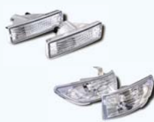
CRYSTAL WINKER SILVIA S13

クリスタルウィンカー ¥7,140 クリスタルエラーレンズ ¥10,290 クリスタルウィンカーSET ¥15,750