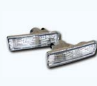
CRYSTAL WINKER 180SX M/C前 R(P)S13