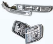
CRYSTAL WINKER SILVIA S14 M/C後

クリスタルウィンカー ¥10,290 クリスタルエラーレンズ ¥10,290 ■クリスタルウィンカーSET ¥18,900