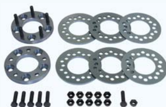
マルチトレッドスペーサー 適合表